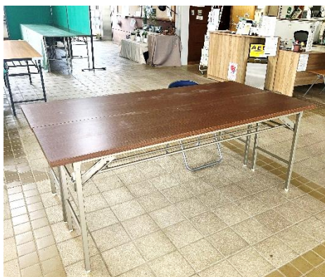
長テーブル2台向い合せ